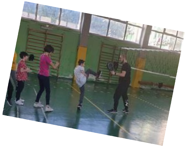
Dimostrazione di Taekwondo